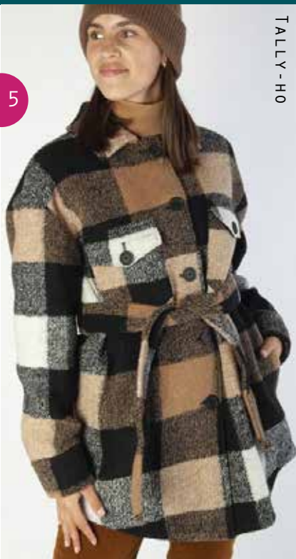
TALLY - HO

Ben je klein van stuk ga dan voor een niet al te lange, getailleerde jas. De trenchcoat/half-lange lichtgetailleerde jas is geschikt voor ieder figuur. Heb je brede heupen draag dan een getailleerd A lijn model. Heb je brede schouders en een volle boezem kies dan voor een jas van wat fijner materiaal, getailleerd en accent bij de zakken.