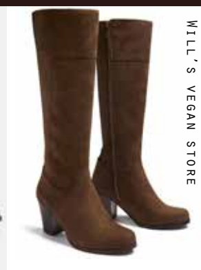
MILL'S VEGAN STORE