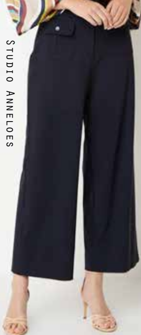
STUDIO ANNELOES VANILIA