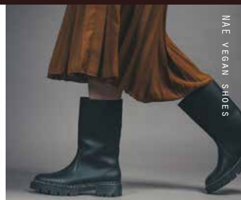
MAE VEGAN SHOES