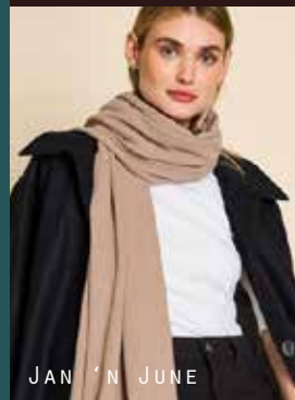
JAN 'N JUNE